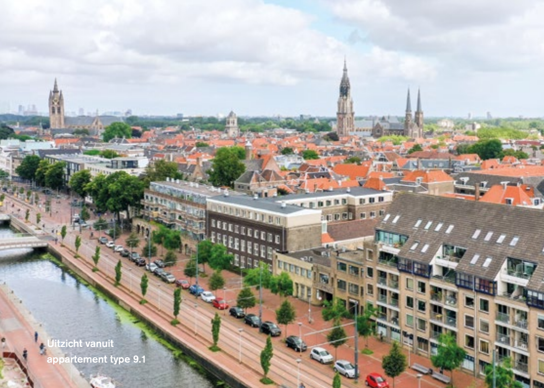
Uitzicht vanuit appartement type 9.1